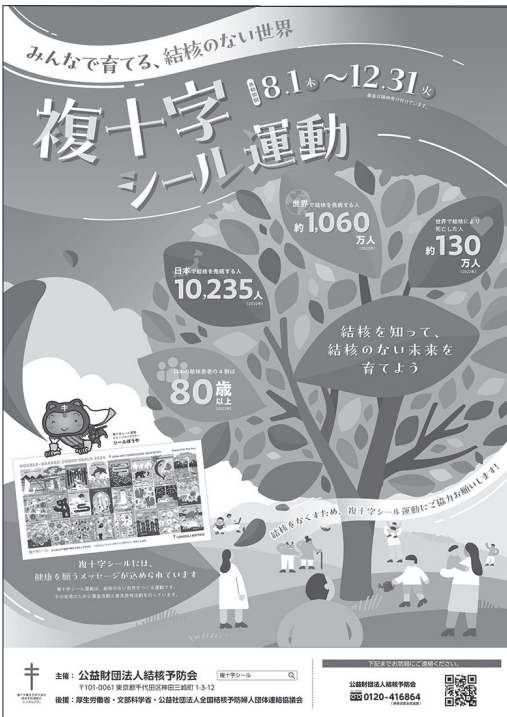
2024年度複十字シール運動ポスター