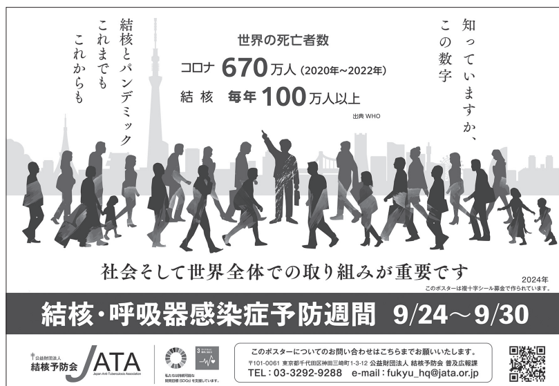
普及啓発ポスター

毎年9月24日～30日に実施されてきた「結核予防週間」に呼吸器感染症予防対策が追加され、本年度より「結核・呼吸器感染症予防週間」と名称が変更されました。結核予防会は都道府県支部と協力して、全国で普及啓発活動を展開いたします。